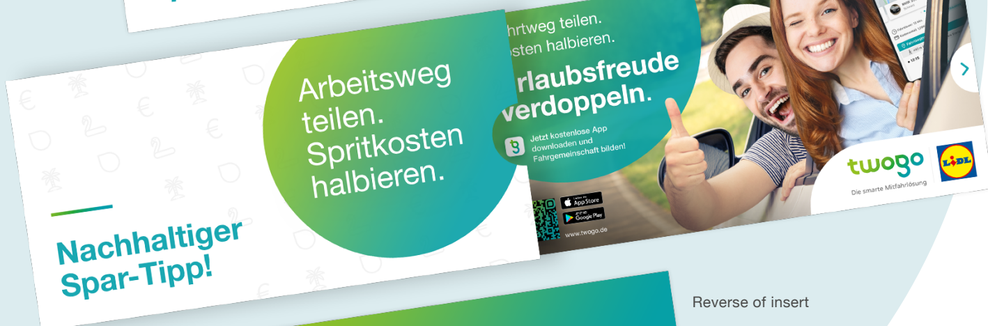
Reverse of insert