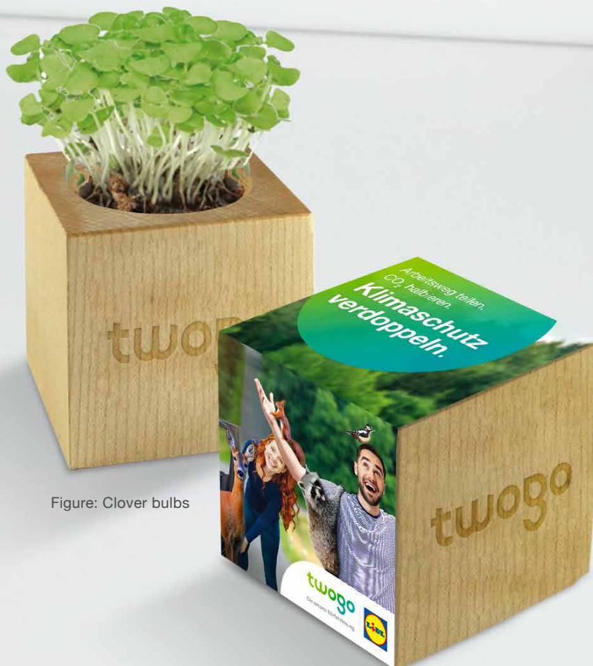
Figure: Clover bulbs