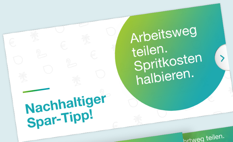
Front cardboard slipcase